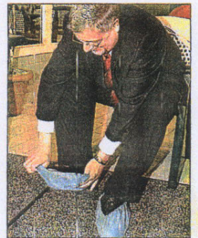
Vor der Besichtigung hieß es für die Gäste zur offiziellen Eröffnung: Überzieher anlegen.

Beim Keltenbad in Bad Salzungen erfolgte die Planung und Bauleitung für die Instandsetzung der vier Solebecken, einschl. Einbauteile, Adichtung, Fliesen, sowie die Nachattraktivierung und die Rekonstruktion der Beckenumgangs-, Dusch- und Restaurantflächen durch Büro Wach - Beratende Ingenieure