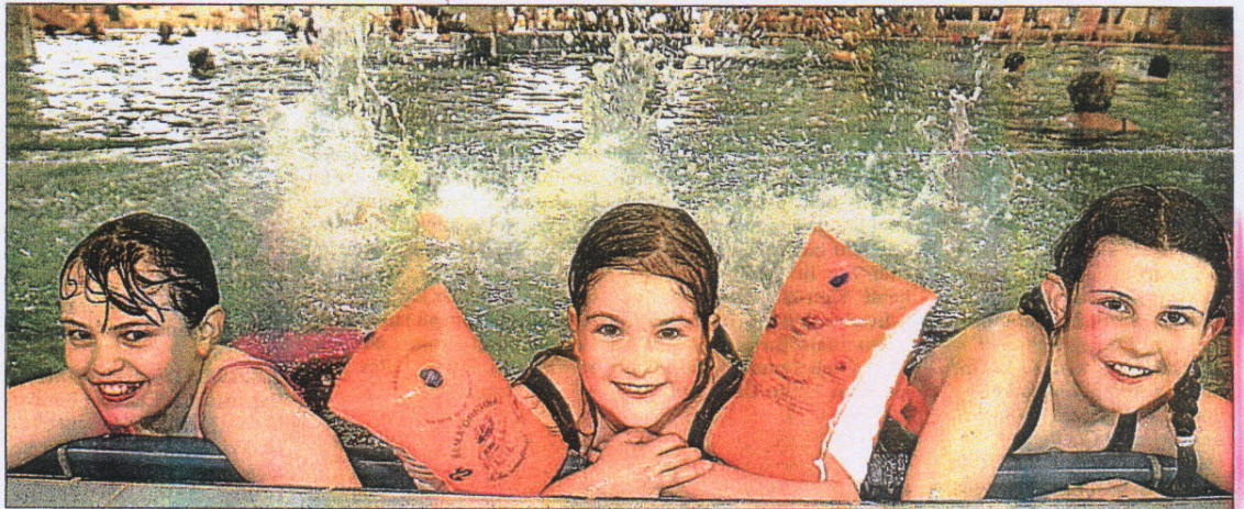
Endlich! Seit drei Tagen kann wieder im Keltenbad geplätscht werden.

Nachdem man im vergangenen Jahr einen „Scherbenhaufen“ vorgefunden habe, sei es eine „reife Leistung“ gewesen, so schnell zu arbeiten. Selten habe er erlebt, dass bei Projekten dieser Art innerhalb von nur vier